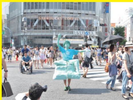
《平和祈念像パフォーマンス》2015 | 都内各所 | 撮影：西原如歩