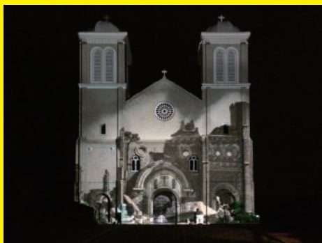
《浦上天主堂再現プロジェクト》2015 | プロジェクション・マッピング